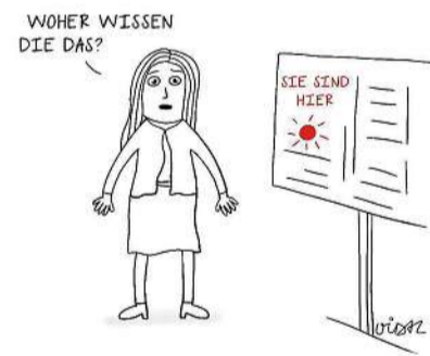
Lola ist die Protagonistin in Fatima Vidals Comic-Tagebuch.