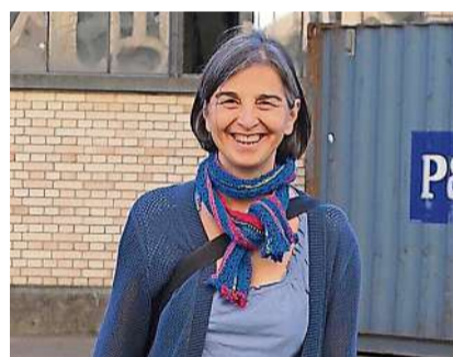
Autorin Fatima Vidal.