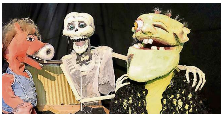
Das Pony ist neues Teammitglied bei der Geisterbahn.

«Geisterbahn!» im Figurentheater Ab 5 Jahren 30. November und 1. Dezember Marktgasse 25, 8400 Winterthur www.figurentheater-matou.com Ticketreservierung touristinfo@winterthur.com